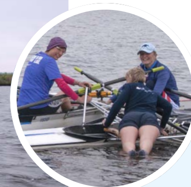
Een eiland van skiffs helpt de omgeslagen roeier in de boot te klimmen.